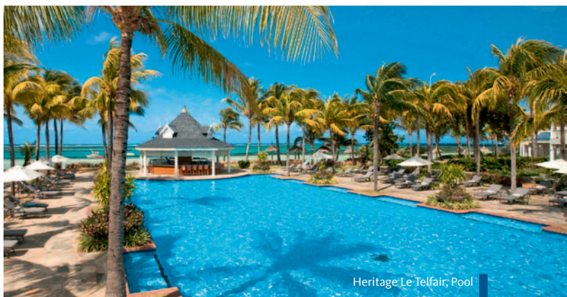
Heritage Le Telfair, Pool