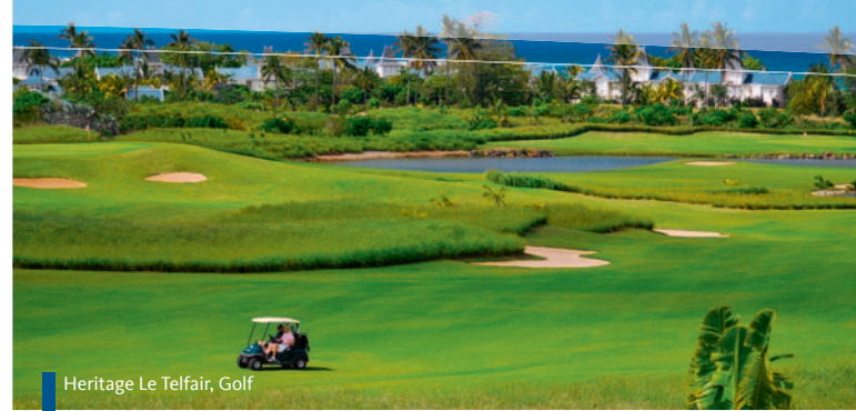
Heritage Le Telfair, Golf