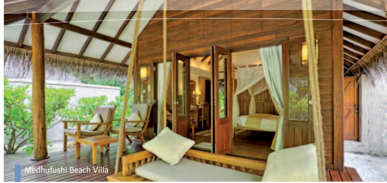
Medhufushi Beach Villa