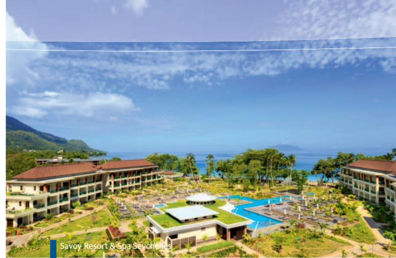
Savoy Resort & Spa Seychelles