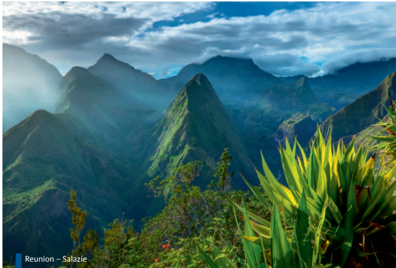
Reunion – Salazie