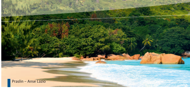
Praslin – Anse Lazio