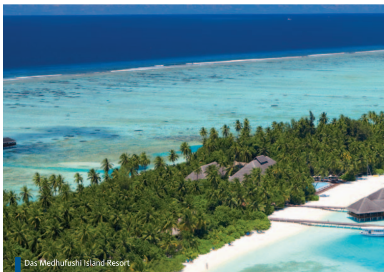
Das Medhufushi Island Resort