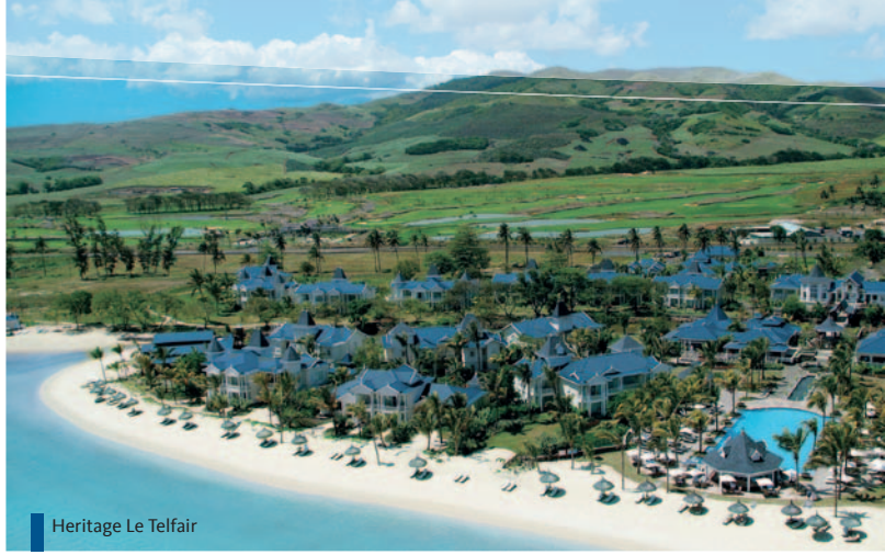
Heritage Le Telfair