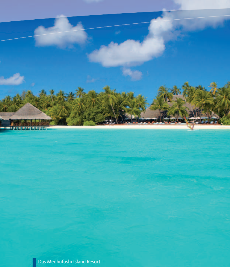
Das Medhufushi Island Resort