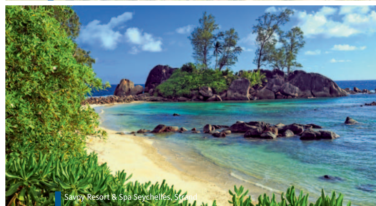
Savoy Resort & Spa Seychelles, Strand